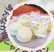
あんなか梅マカロン