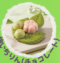
梅いちりん(チョコレート)