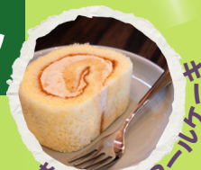
梅しょうゆロールケーキ